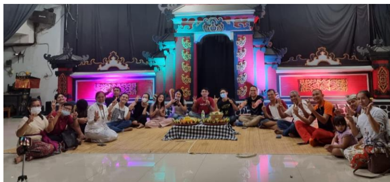
Gambar 1.4 Kegiatan Bersama yang melibatkan Umat

Partisipasi Masyarakat terlebih tokoh umat, sangat diperlukan dalam Upaya pembinaan keumatan. Bagaimana caranya agar Masyarakat bisa terlibat?. Tentu dengan sosialisasi dari PHDI melalui Banjar, tentang urgensi pembinaan keumatan saat ini, utamanya di tiap kelompok ( pemuda, Dahrmika, Wanaprasta). Juga sosialisasi tentang metode pembinaan dan rencana kerjanya. Keterlibatan Masyarakat dalam hal ini bisa berupa : pengetahuan, tenaga/organizer, dana/biaya (wawancara, 30 Mei 2024).