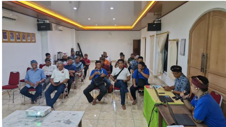
Gambar 1.1 Koordinasi Antara Pengurus PHDI dan Banjar

Berdasarkan pendapat dari informan 2 ini menunjukkan bahwa adanya rencana kerja yang disusun bersama untuk mensinergikan pembinaan keumatan yang berjalan secara berjenjang. Hal ini juga dilakukan dengan adanya rapat koordinasi yang dilakukan baik pengurus banjar dan PHDI dalam menunjukan eksistensinya dalam pembinaan keumatan.