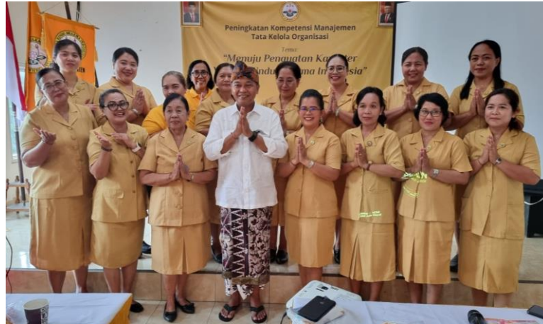
Gambar 1.3 Pembinaan Kompetensi WHDI dalam lingkup Organisasi

Pandangan informan 2 ini jelas menunjukkan bahwa kompetensi yang harus dimiliki oleh umat Hindu pada tatanan yang paling dasar memberikan pemahaman dari nilai Hindu yang tidak terkesan eksklusif melainkan ajaran yang mudah dipahami.