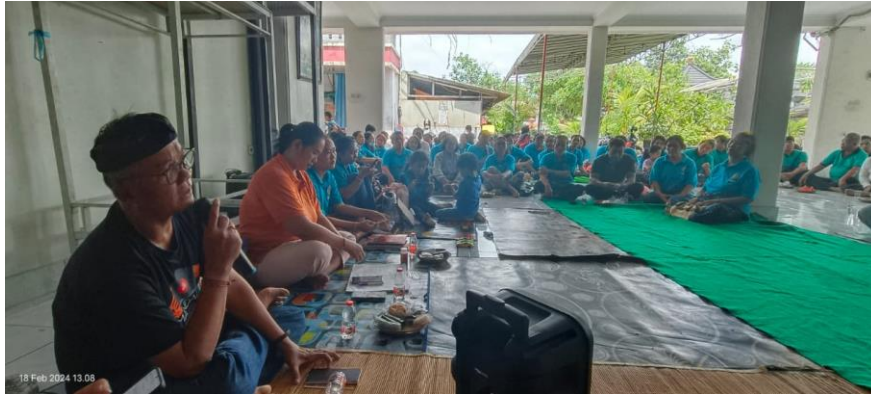
Gambar 1.2 Program PHDI dan Banjar dalam dengar pendapat di Tempek

Pendapat informan 1 ini menjadi pembicaraan kunci bahwa pembinaan dan pengembangan program yang ada didalamnya merupakan hal yang tidak dapat dipisahkan karena finalkan adalah untuk kepentingan umat Hindu. Disisi lain bahwa estafet kepemimpinan hanya terjadi pada tatanan ritual. Hal ini PHDI dan Banjar melakukan kegiatan untuk menjangring jejak pendapat dari tempat yang dilakukan secara rutin.