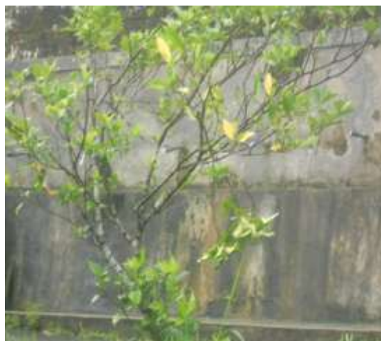
Gambar 2. Tempat Wudhu di Sebelah Barat Pura