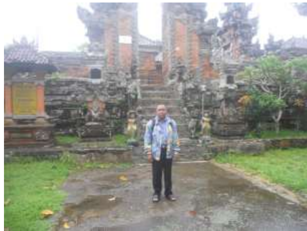
Gambar 1. Pura Penataran Agung Dalem Jawa