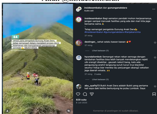
Gambar 3 Atraksi Wisata Pada Unggahan Akun @insidesembalun